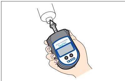
■ 被測定物の回転中心に接触子を当て、計測します。